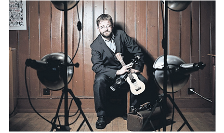
El Ritschi tritt am nächsten Donnerstag auf der Vario-Bühne auf.

VARIO BAR Die Musik- und Lesebühne Wortklang feiert am Donnerstag, 16. Februar in der Vario Bar Olten den Abschluss der aktuellen Saison. Mit drei Künstlern aus Musik, Spoken Word, Slam Poetry und Literatur wird ein spannender Mix geboten, den man sonst nirgends findet.