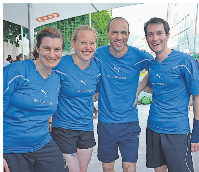
Das Ziel des motivierten und gut gelaunten BW ZOFINGEN-TEAMS am FIRMENTURNIER vom Freitag war klar: «Wir wollen in den Center Court.»

Grund zum Feiern hatten bei den Damen (v.l.) BETSCHART / HÜBERLI (2.), GRÄSSLI / SCIARINI (1.) und CARVALHO / THAIS (3.). Bei den Herren (v.l.) GAUDIE / SANTOS (2.), PONIEWAZ B. / WALKENHORST (1.) und GABATHULER / GERSON (3.).