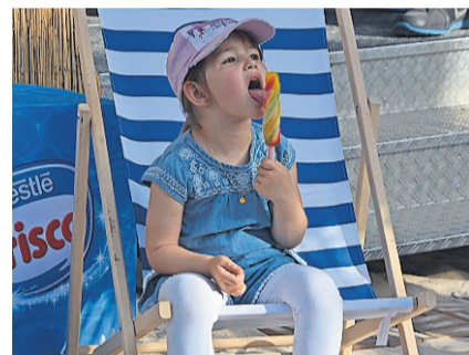
TAMINA genoss das Beachfeeling und ihr Glace in vollen Zügen.