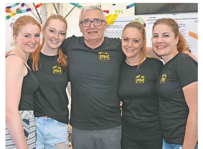
Das aufgestellte Team von VOLLEY SCHÖNENWERD versorgte die Besucher mit feinen Drinks.