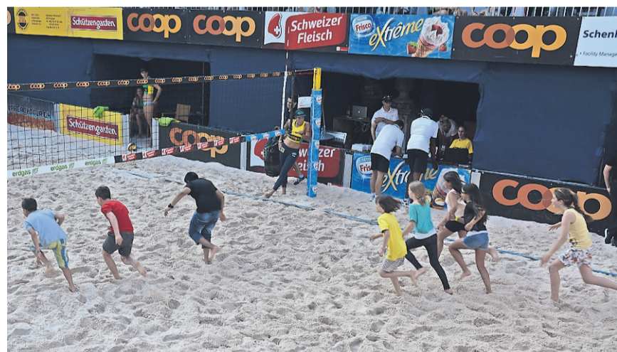
Achtung, fertig, los: Die KLEINEN ZUSCHAUER konnten ihr Glück bei verschiedenen GEWINNSPIELEN IM SAND versuchen.