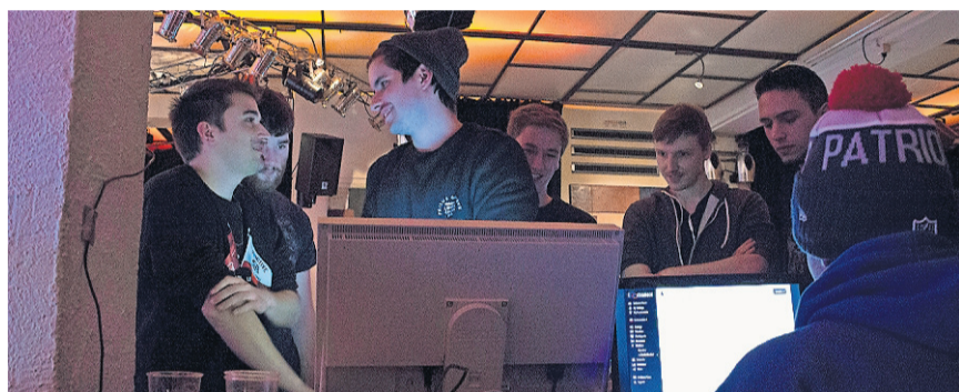
WER SCHAFFT ES INS FINALE?: In den Spielpausen wurden eifrig die PUNKTESTÄNDE AUF DEM MONITOR verfolgt.