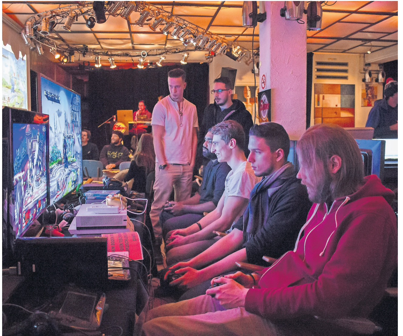
GEMEINSAM SPASS AM GAMES: In der Vario Bar liefen am vergangenen Wochenende die Konsolen heiss.