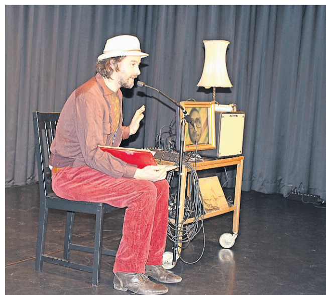
Das Duo SCHNUDER BRÄCHLI aus dem Aargauer Fricktal spielte mit Märchen für Erwachsene den Kindheitserinnerungsbonus aus.

Das PUBLIKUM wählte zuerst zwei Finalisten per Cornichon und dann den Casting-Sieger per Abstimmungskarte.