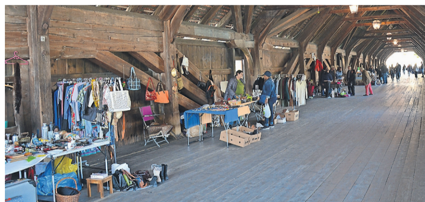
Die HOLZBRÜCKE gewährte dem FLOHMARKT an diesem schönen Samstag ein weiteres Mal «Unterschluß».

Die nächsten Flohmärkte finden jeweils samstags am 27. Mai, 1. Juli, 29. Juli, /26. August, 30. September und 28 Oktober statt.