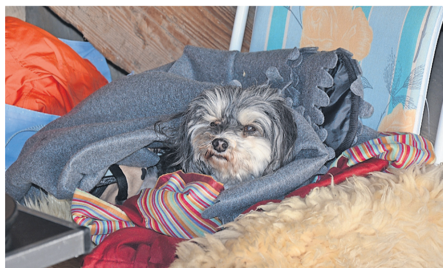
Einer nahm das BUNTE TREIBEN am Oltner Flohmarkt etwas gemütlicher und lehnte sich warm eingepackt zurück.