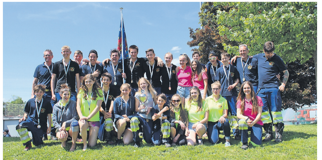
Die JUGENDFEUERWEHRER AUS BUCHBERG-RÜDLINGEN. Hier auf dem Bild das Siegeream (oben links mit Fahne), das viertplatzierte Team Buchberg-Rüdlingen 2 sowie das Team Buchberg-Rüdlingen Girls.