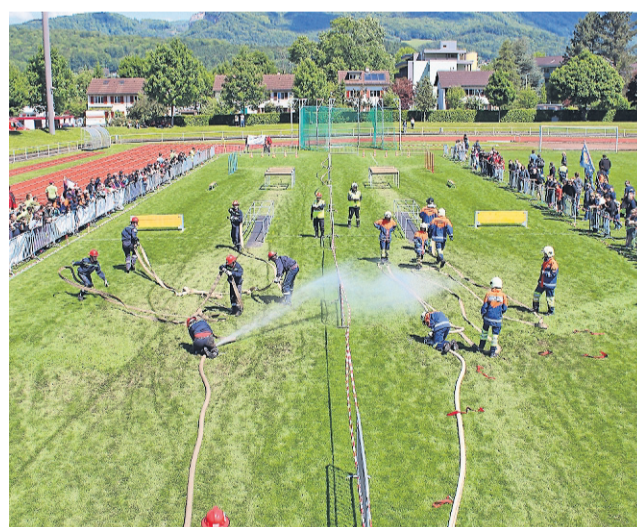
DER FINALLAUF: das TEAM BÖDELI (l.) aus Interlaken gegen das Team aus BUCHBERG-RÜDLINGEN 1.