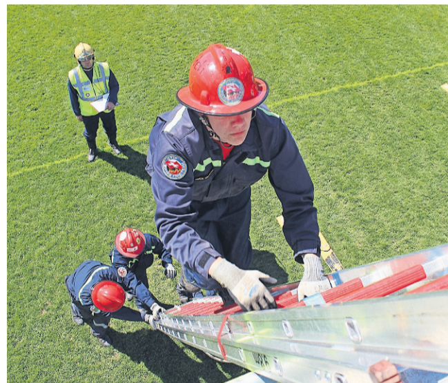
Ein TEAMMITGLIED DER JUGENDFEUERWEHR BÖDELI aus Interlaken beim Erklimmen «des Turms». Hier beim Finallauf, welcher am Sonntag stattgefunden hat.