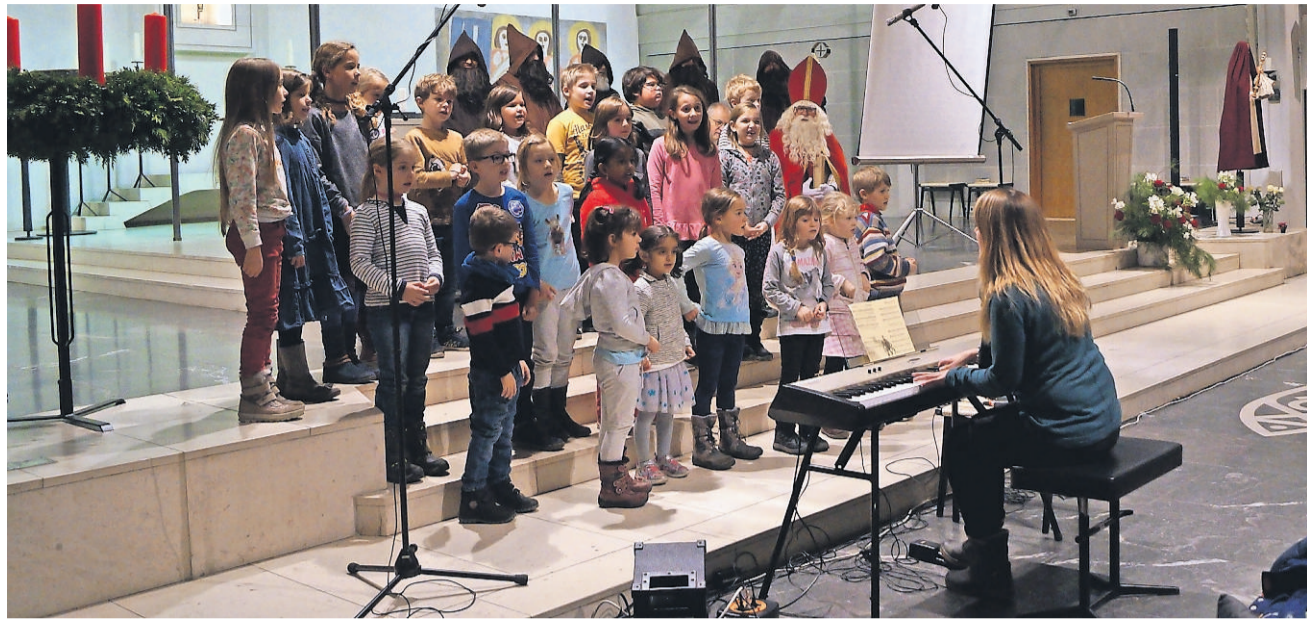
Der Kinder- und Jugendchor begrüßte den St. Nikolaus und sang «Willkommen, lieber Samichlaus, endlich bist du da.»

«Das Aussenden ist für uns jedes Jahr ein wichtiger Familienanlass.»