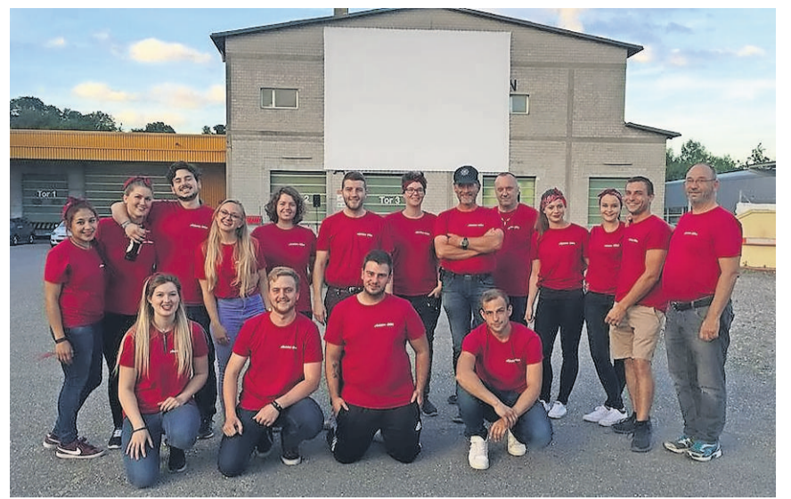
Auch in diesem Jahr können Film- und/oder Auto-Fans dank der Gruppe Autokino Olten Filme unter freiem Himmel in der Oltner Industrie geniessen.

Stadtanzeiger Ziegelfeldstrasse 60 4601 Olten redaktion@stadtanzeiger-olten.ch www.stadtanzeiger-olten.ch