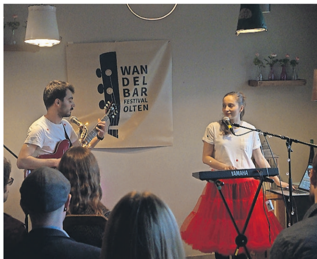
Das Duo «SCHÖNI FRAU» verzauberte im RESTAURANT STADTBAD mit ihrem Dream Pop.